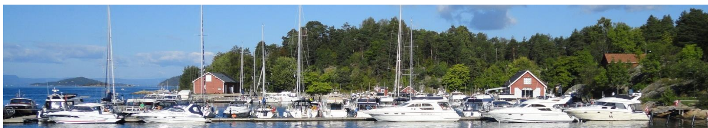
Oscarsborg, Oslofjorden.